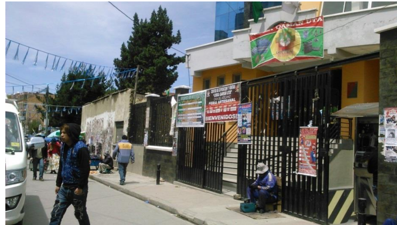
COSEDAL en un día de feria con presencia de gremiales